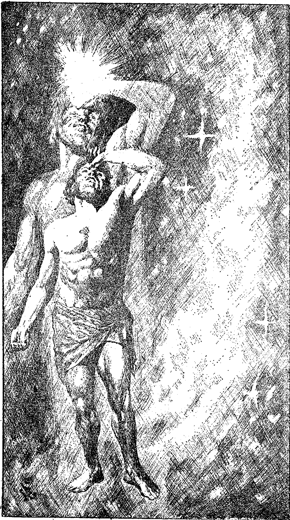
Faint, illegible text at the bottom of the page, possibly a title or description.